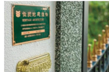
伝統的建造物に認定された、異人館で過ごす特別なひととき

神戸北野の高台に1900年(明治33年)に建てられた白亜の館、「北野異人館 旧レイン邸」。伝統的建造物に認定されながらも、一般には非公開とされてきました。細部まで贅を極めた珠玉の館で、特別なパーティをお楽しみください。